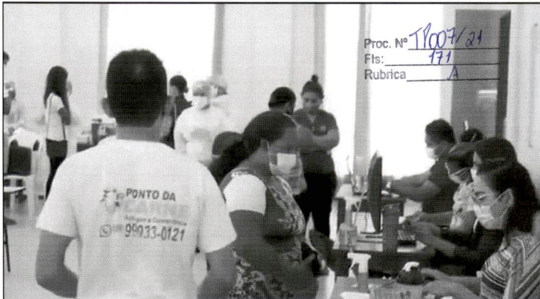
Vacinação no Centro Municipal de Imunização em Balsas

PREFEITURA DE BALSAS Continua a construção da cidade que queremos